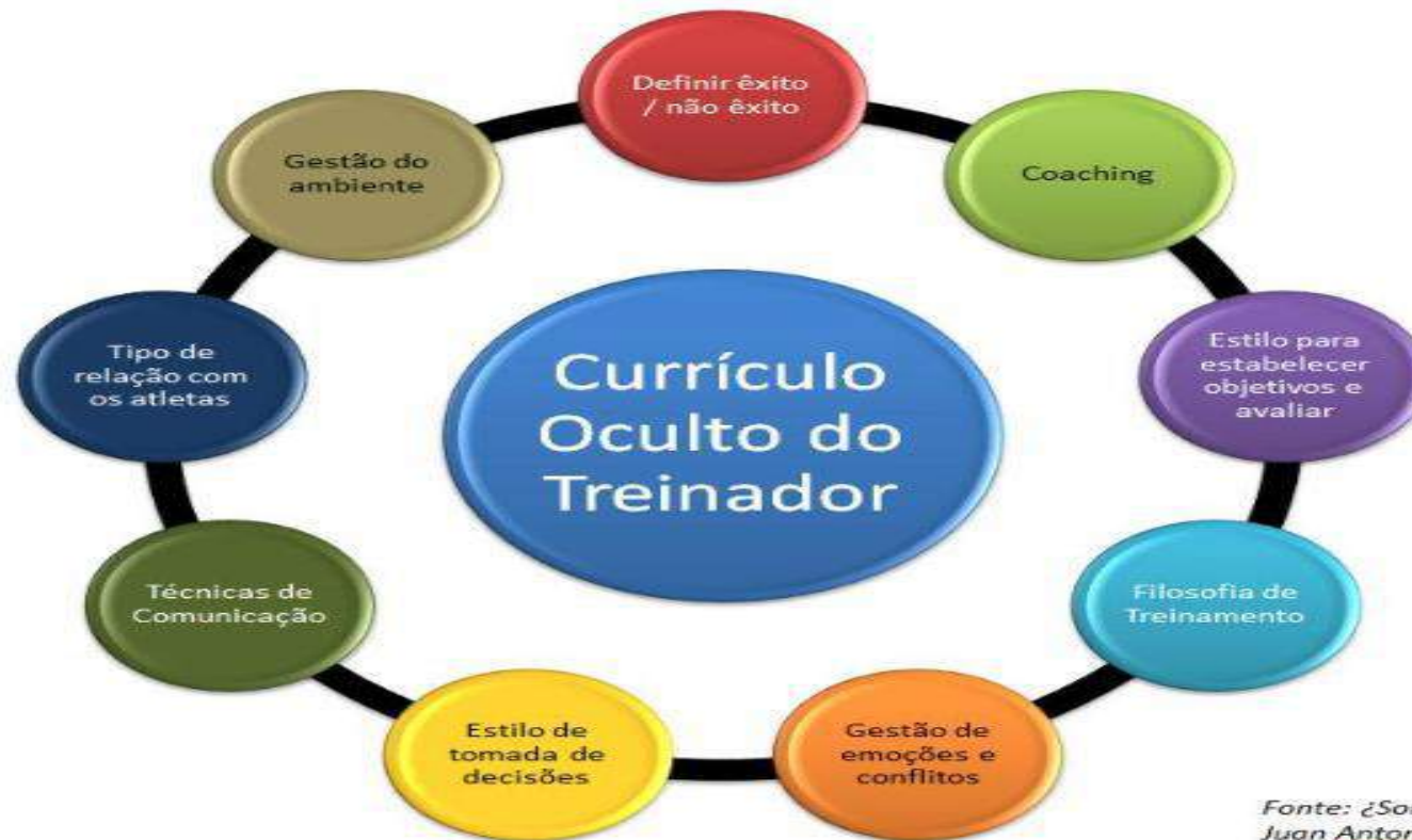
Fig. 2 – Elementos do Currículo “Oculto” do Treinador