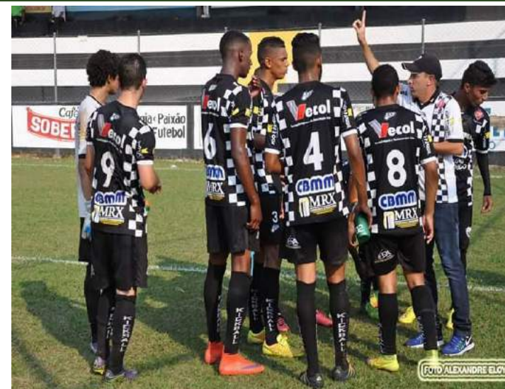
Treinador Categoria de Base