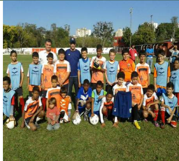
Área Acadêmica – Professor Escolinha